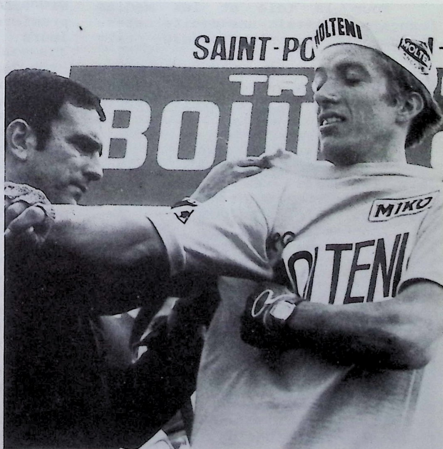
Joseph BRUYERE revêt le maillot jaune à St Pol de Léon au Tour de France 1974